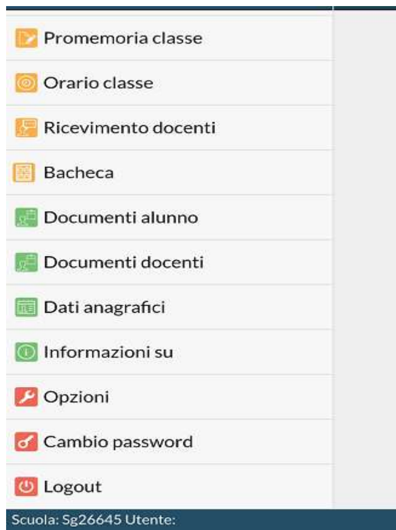
Fig.4 smartphone/tablet "DidUP Famiglia"

Identico percorso per la app " DidUP Famiglia " da smartphone/tablet (disponibile su App Store e Google Play ), anche se con grafica diversa (figura 4).